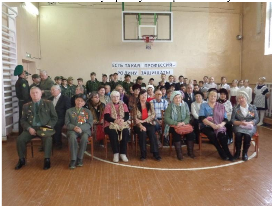
гости праздника «Вручение формы» - члены Совета ветеранов Туймазинского района

В заключении праздника кадеты школы представили концерт для гостей праздника, среди которых были и родители и товарищи из других классов, которые не избрали кадетскую направленность обучения в школе. Однако дружба между детьми не иссякла, ведь это честь – иметь в друзьях кадета школы, так считают все учащиеся школы. Перед отъездом гости посетили школьный музей имени Э.Солодовникова, остались под впечатлением от собранного материала и оставили благодарственные записи в Книге гостей за проводимую в школе воспитательную работу по патриотическому воспитанию.